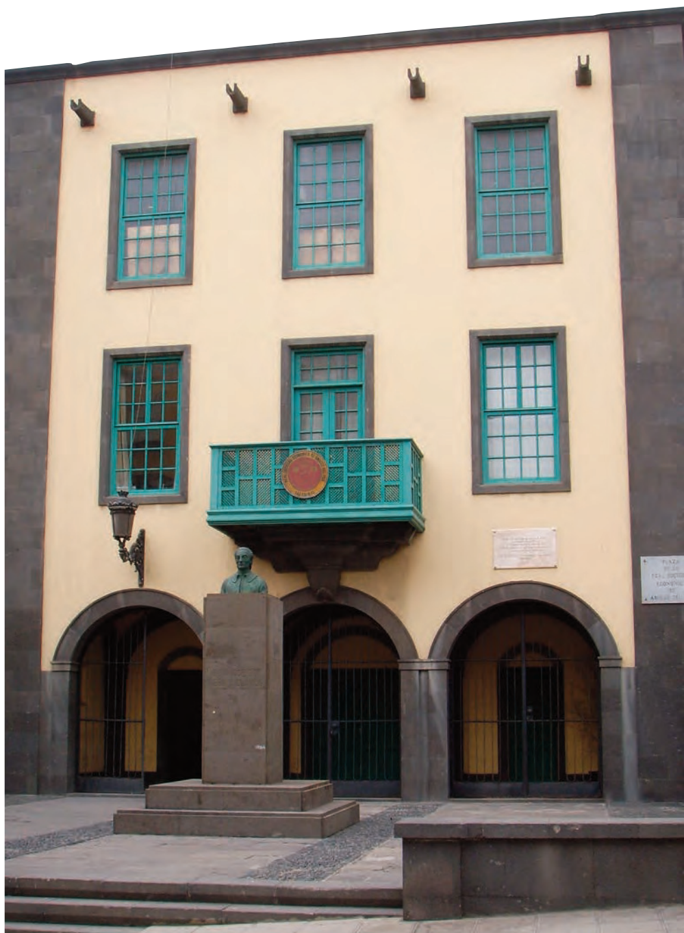
Real Sociedad Económica de Amigos del País de Gran Canaria

A pesar de que el siglo XVIII supuso un periodo de cambios en la educación en las Islas Canarias, en términos generales hay que resaltar que la enseñanza primaria en las islas durante estos años está marcada por la precariedad, debida fundamentalmente a la escasez de medios económicos.