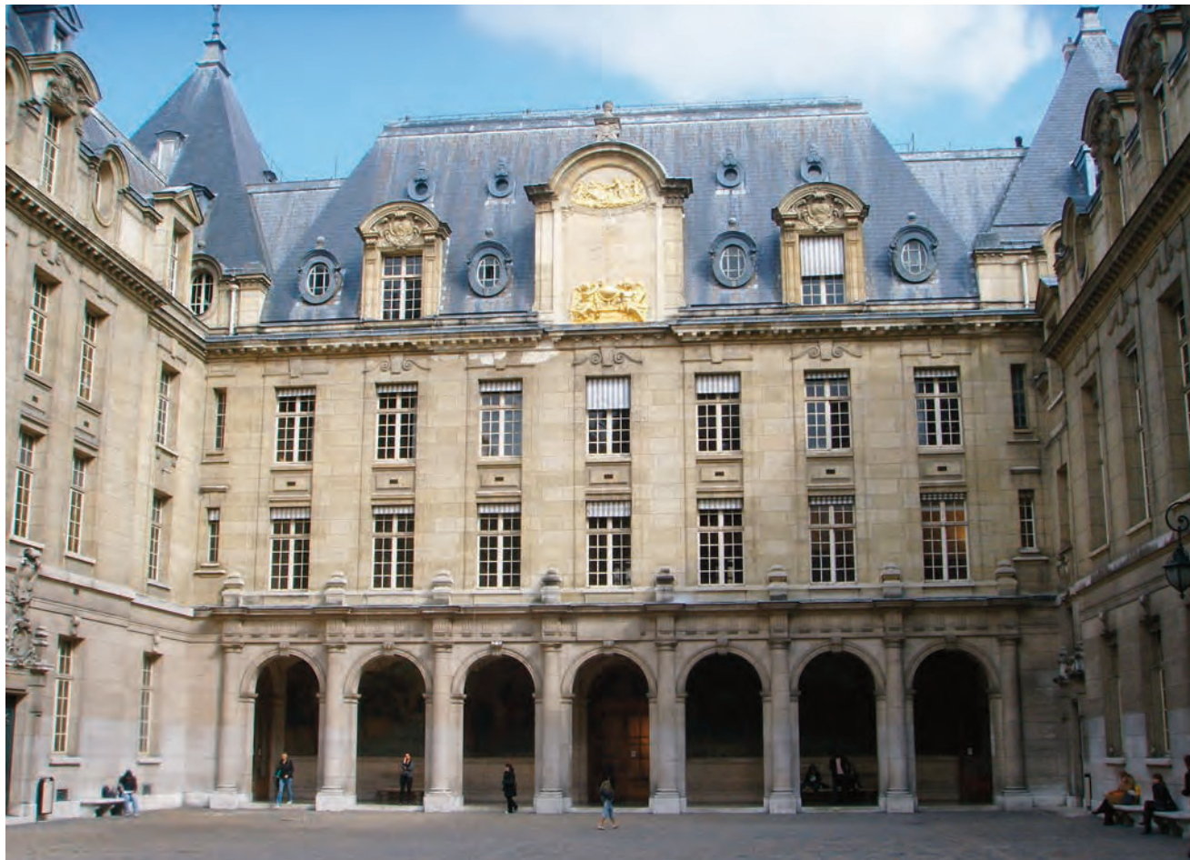
Universidad de La Sorbonne, en cuya biblioteca se encuentra el único ejemplar del poema L'Éloquence

Muestra de esta pasión por la cultura gala es la gran cantidad de obras francesas que Viera y Clavijo tradujo e imitó. Es importante, llegados a este punto, matizar la distinción entre traducción e imitación, pues Viera se preocupó por dejar la impronta de su propio pensamiento en muchas de las obras que le fascinaron.