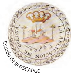
Escudo de la RSEAPGC

Sin embargo, como afirma Negrín Fajardo (1982: 16), su actividad educativa no se limita a proveer de escuelas, sino que abarca un amplio catálogo de acciones, pues: