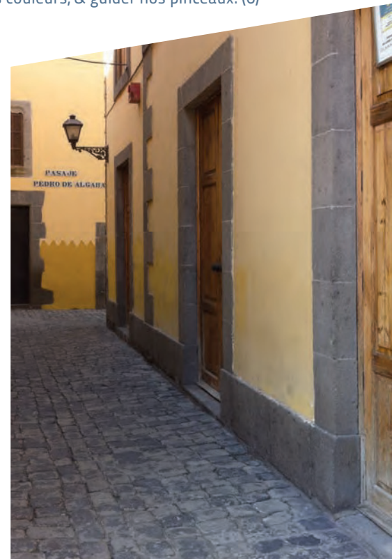
Biblioteca Pérez Vidal, donde se conserva el texto completo de La Elocuencia

Para ello, sigue el modelo de Horacio y rechaza el de Séneca, tal y como recita el Abate: