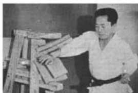
General Choi Hong Hi