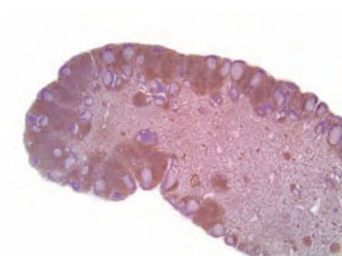
▲ Figura 1. Ganglio linfático. Especie canina. Tinción inmunohistoquímica empleando el anticuerpo anti-CD3, que identifica células T en la zona parafolicular de un ganglio linfático normal.

Como conclusión, hay que enfatizar la importancia de un diagnóstico