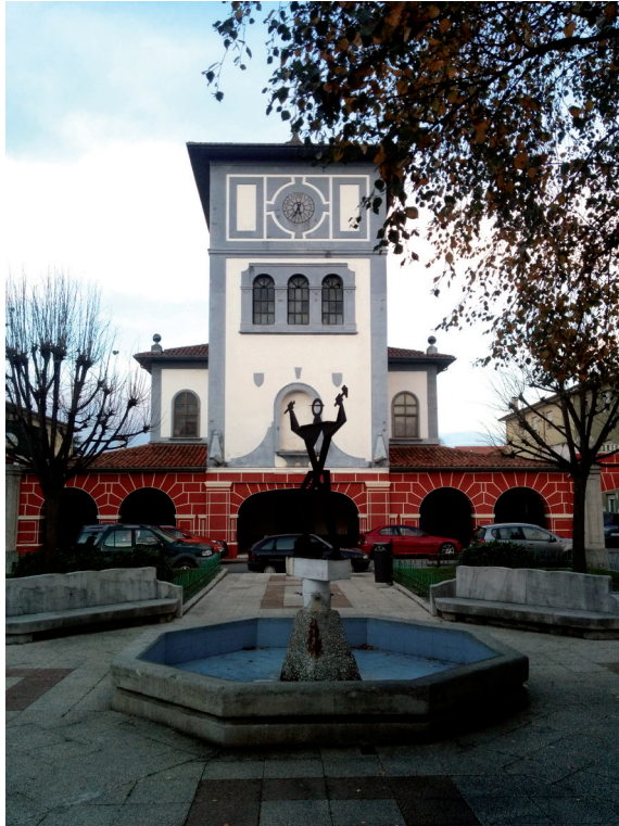
Lámina 4. Plaza del poblado de El Salvador, en diciembre de 2013 (Fotografía de la autora).

Especialmente significativos fueron los altercados en relación al sacudido de las alfombras en los poblados, para lo cual estaban estipuladas las primeras horas de la mañana (antes de los nueve), y los turnos de los grupos de limpieza de escaleras, en los bloques de pisos, que corrían a cargo de las propias vecinas. La basura fue, asimismo, la causante de animosas disputas en cuantiosas ocasiones. La recogida se realizaba por el personal específicamente designado por la empresa, en torno a las ocho y media de la mañana, todos los días de la semana. Poco tiempo antes de esa hora, las amas de casa (en la revista de la SNIACE, a ellas en exclusiva se les adjudicaba la labor) 20 debían depositar los desechos en los cajones