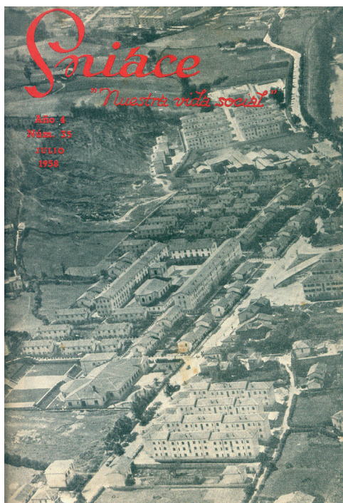
Lámina 3. Vista general de los poblados obreros, en el año 1958

Una vista aérea de la zona de los poblados da buena cuenta de estos instrumentos de vertebración del espacio; la carretera nacional entre Santander y Palencia o avenida de Solvay, recorre longitudinalmente toda la Lámina 3.