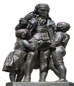
Figura 3. Monumento escultórico (1890, Yverdon les Bains, Suiza). Autor: Kart Alfred Lanz

En su segunda etapa, en cambio, define los principios fundamentales de la metodología, que aparecerán recogidos en algunas de sus obras como El método de Pestalozzi (1800), El libro de las madres (1803), El ABC de la intuición (1803), y quizá la más completa y difundida, Cómo Gertrudis enseña a sus hijos (1801). En ella se produce la gestación de su teoría educativa de la intuición , creando un colegio y una escuela para la formación de maestros en su método. Para el profesor Almeida Aguiar, los principios teóricos de Rousseau adquieren una concepción más clara y más precisa, orientándose en una dimensión educativa real y práctica con una orientación moderna, resultado de una pedagogía entresacada de la observación diaria.