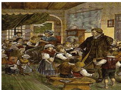
Figura 2. Anónimo (c.1880). Johann y Anna Pestalozzi en el orfanato de Neuhoft

En su artículo Pestalozzi y la pedagogía social como forma de redención , el profesor Jordi Planella (Universitat Oberta de Catalunya), trata de ofrecer una visión general de la vinculación de Pestalozzi con la Pedagogía Social y de sus aportaciones a este campo disciplinar, indagando en las vinculaciones entre lo que hemos convenido en denominar Pedagogía Social y las aportaciones a la misma del pedagogo suizo. En este caso, el profesor Planella nos expone que una parte muy importante de los proyectos, de las experiencias y de las ideas propuestas por Pestalozzi se sitúan en lo que denomina como “educación más allá de la escuela”, como Educación Social.