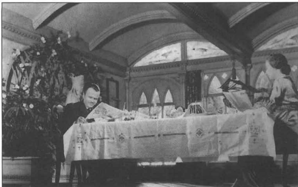
Wellles utiliza los techos como elementos definidores del espacio.

mo lo hizo cuando lo separaron de sus padres) sanciona la muerte del protagonista 18 .