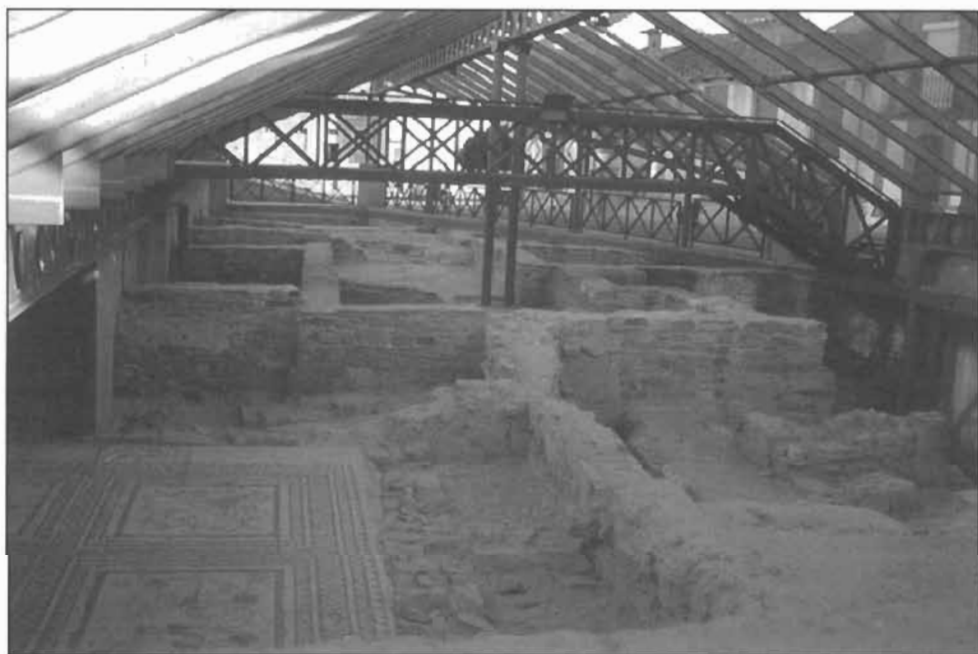
Figura 4: Conservación y puesta en uso social de los restos romanos de Astorga.