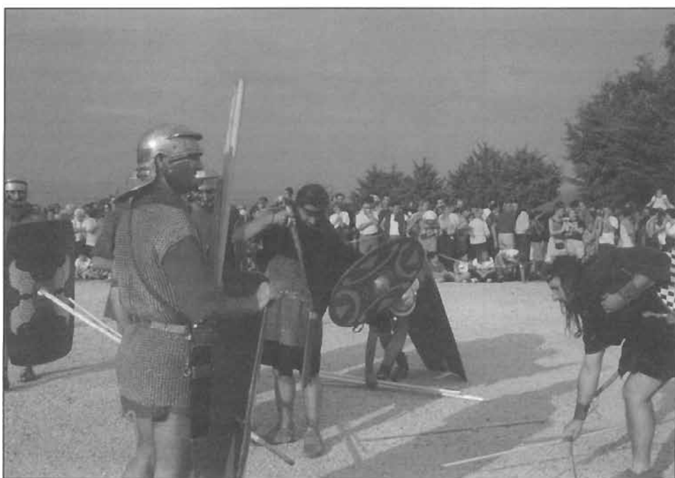
Figura 2: Escenificación "El cerco de Numancia". Agosto, 1999.