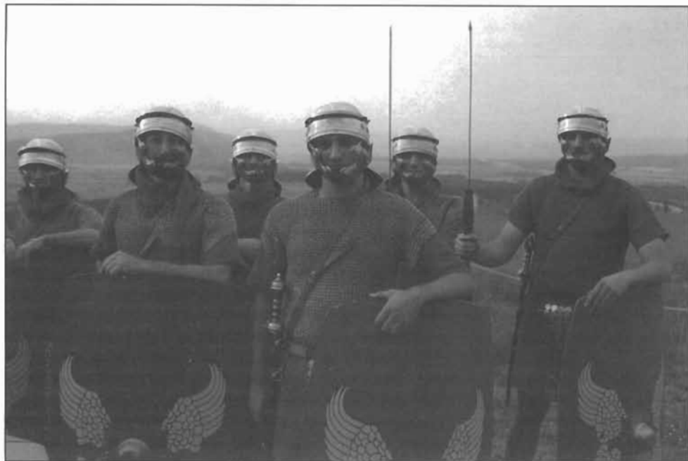
Figura 3: Soldados romanos "El Cerco de Numancia". Agosto, 1999.