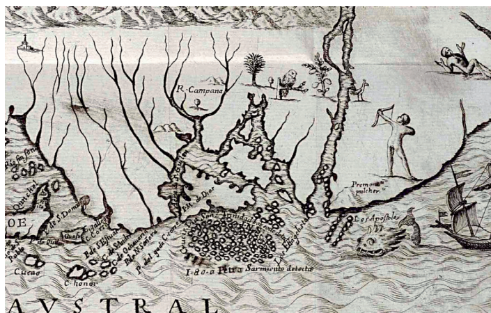
Figura 4. Alonso de Ovalle. Tabla Geographica del Reyno de Chile, 1646. AGI, Mapas y Planos, Perú y Chile, 271 (Detalle)