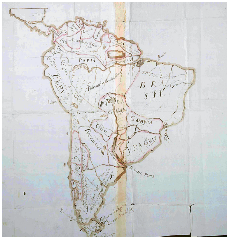
Figura 4. «Mapa de América del Sur con indicación de tierras habitadas por extranjeros», Archivo General de Indias (en adelante AGI), Mapas y Planos, Perú y Chile, 176.

el inglés John Narborough, en diciembre de 1671, con fines exploratorios y comerciales, aunque nada muy claro, lo que trajo como consecuencia la alarma de posibles asentamientos ingleses. La carta y mapa de Pantoja ocasionó la orden al gobernador de Chile, el 26 de febrero de 1681, para hacer averiguaciones sobre este establecimiento. 11