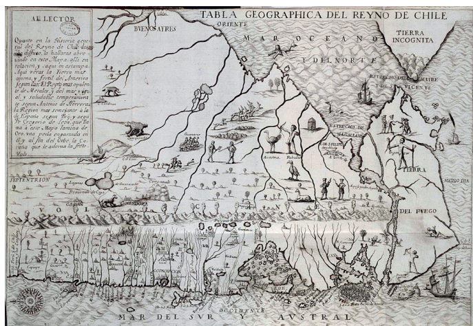
Figura 2. Alonso de Ovalle. Tabla Geographica del Reyno de Chile, 1646.

posteriores copian la información de Ovalle: de izquierda a derecha, el nutrido archipiélago y, distinguida, la isla Madre de Dios. Este es el caso, por ejemplo, del mapa del geógrafo francés Nicolás Sanson, de 1657, 5 y el de Vincenzo María Coronelli, de 1690. 6 De esta forma, la cartografía conservó el topónimo inventado por el jesuita Ovalle, y que ha llegado hasta nuestros días.