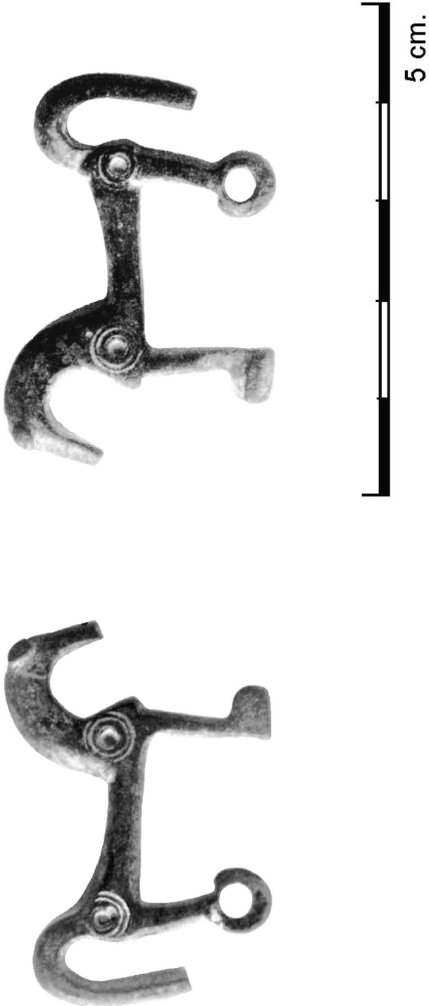
Lámina 1. Fotografía del ejemplar.