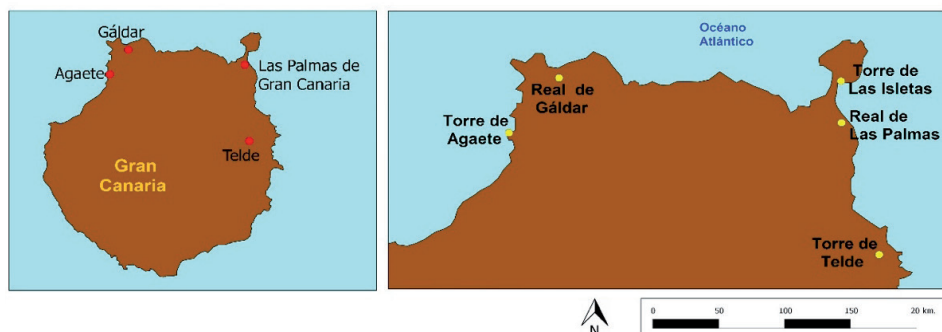
Figura 2. Mapa de Gran Canaria con la localización de los reales y fortificaciones de la conquista. Elaboración: Ángel Marchante Ortega.

de un real «de tapias» (SEDEÑO, 1978: 354), añade que los castellanos fabricaron «tringueras y torreones de tapias y de piedras lo mexor que pudieron» (SOSA, 1994:126). Gómez Escudero, que parece avalar de manera confusa la existencia de un caserío indígena en el emplazamiento del real, relata que «se acordó fabricar una torre, i con diez tapias i mucha jente en poco tiempo hacían mucha serca» (GÓMEZ ESCUDERO, 1978: 393).