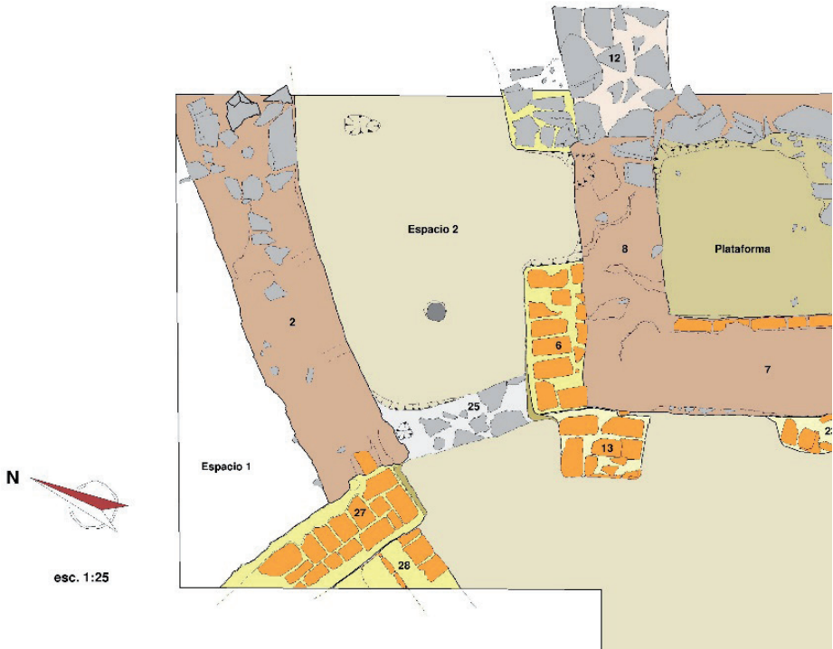
Figura 11. Planimetría del sondeo 1 del yacimiento de Fum Asaca (ST-J1) donde se observan algunos restos constructivos correspondientes a la torre de San Miguel de Asaca. Dibujo: Miguel Ángel Hervás Herrera.

la ausencia de reconstrucciones o reocupaciones del edificio. Al mismo momento corresponde, sin duda, el tramo de la cerca perimetral de tapial, reforzada con rafas de mampostería, localizado en el Sondeo 2 (Figura 12). Constituida por un muro de un metro de anchura, dicha cerca aparece antecedida, en algunos sectores del yacimiento, por un foso artificial excavado en el terreno. Por último, en el Sondeo 3 se identificaron estratos ricos en materiales pertenecientes a ese momento que hay que interpretar como productos de desecho.