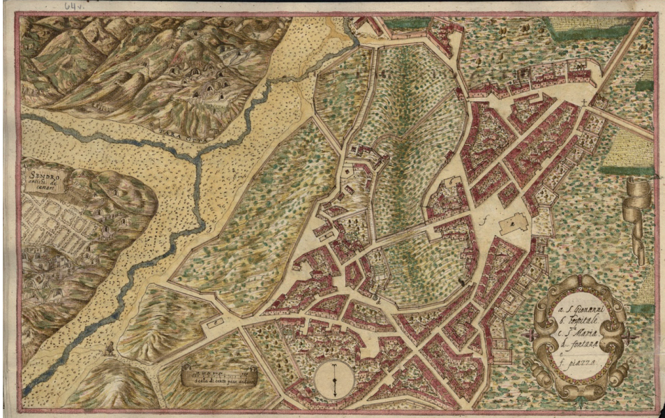
Figura 5. Plano de la ciudad de Telde de Leonardo Torriani (s. XVI) donde se observa la iglesia de San Juan. Biblioteca Geral da Universidade de Coimbra. Descrittione et historia del regno de l'isole Canarie gia dette le Fortunate con il parere delle loro fortificationi (Ms 314).

descartar, por inadecuado, el proyecto de fortificación de la parroquia propuesto por el gobernador Luis de la Cueva y Benavides y a decantarse, en cambio, por fortificar el altozano de Santa María y su pequeña iglesia, lugar en el que más tarde se erigirá el convento de San Francisco.