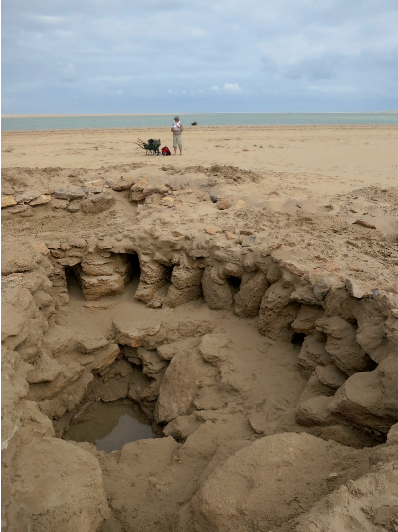
Figura 9. Detalle del interior de los restos de la torre de Santa Cruz de la Mar Pequeña. Sobre la solería, alterada por una remoción de la estructura que hace aflorar el agua de la laguna, se asentaría la base de la cepa. En torno a ella se observan los acondicionamientos donde irían encastradas las aspas para afirmarla.

sucedido desde el abandono de la fortaleza y no parece improbable, antes al contrario, que sus materiales constructivos fueran objeto de un expolio sistemático.