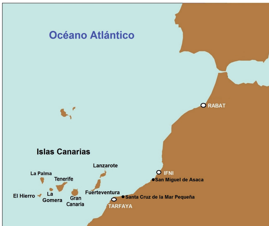
Figura 1. Mapa de las islas Canarias y de la Berbería de Poniente con la localización de las torres de Santa Cruz de la Mar Pequeña y San Miguel de Asaca. Elaboración: Ángel Marchante Ortega.

de realengo, y a partir de ahí implantarse en la costa sahariana vecina con el fin de sacar, como Portugal, partido del comercio caravanero, de facilitar las incursiones esclavistas, y de proteger y preservar la importante actividad que realiza en la zona la flota pesquera castellana, mayoritariamente andaluza (RUMEU, 1996; AZNAR, 1997).