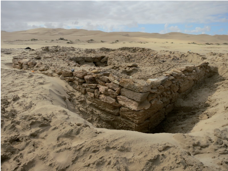
Figura 8. Vista de los vestigios de la torre de Santa Cruz de la Mar Pequeña durante los trabajos de retirada de arena de 2013.

remociones de que ha sido objeto la estructura, sobre los sillares aún se conservan, zonalmente, algunas hiladas de mampuestos del mismo material trabados con un mortero de cal de buena calidad. Sin duda, el elemento más singular y enigmático de la construcción está constituido por la veintena de aberturas, de inclinación y sección descendentes de dentro hacia afuera, que se documentan en el cuerpo del edificio. Fueron realizadas con total seguridad en obra y han sido unánimemente identificadas como saeteras. A partir de esta asimilación, que ya encontramos en las descripciones de Antonio María Manrique y Donald Mackenzie, Pascon y Monod, y en su estela los demás autores que se han ocupado con posterioridad de esta fortaleza, interpretaron los restos visibles como un parapeto que remataría la torre, afectada, según ellos, por un fenómeno combinado de subsidencia y colmatación sedimentaria. Esta dinámica de fosilización explicaría, a un tiempo, la escasa elevación de los paramentos y la insólita disposición de las saeteras.