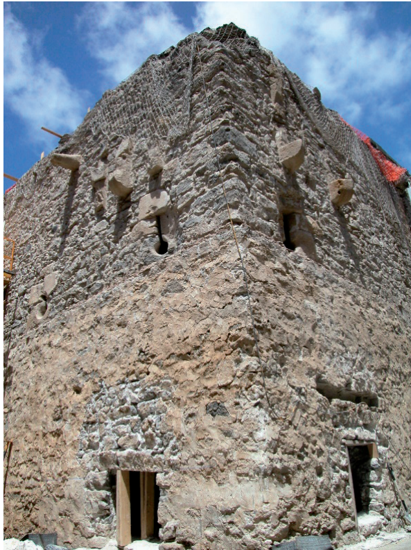
Figura 7. Vista de la torre de Las Isletas durante los trabajos de excavación de 2001-2002.