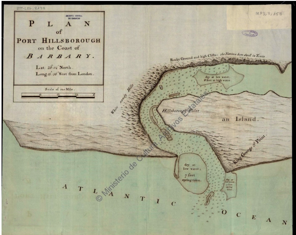
Figura 10. Plano de la laguna de Jnifiss levantado por George Glas (s. XVIII). El emplazamiento de la torre de Santa Cruz de la Mar Pequeña se corresponde con la pequeña “isla” que se observa a la izquierda de la laguna, muy cerca de las dunas ( white sandy hills).