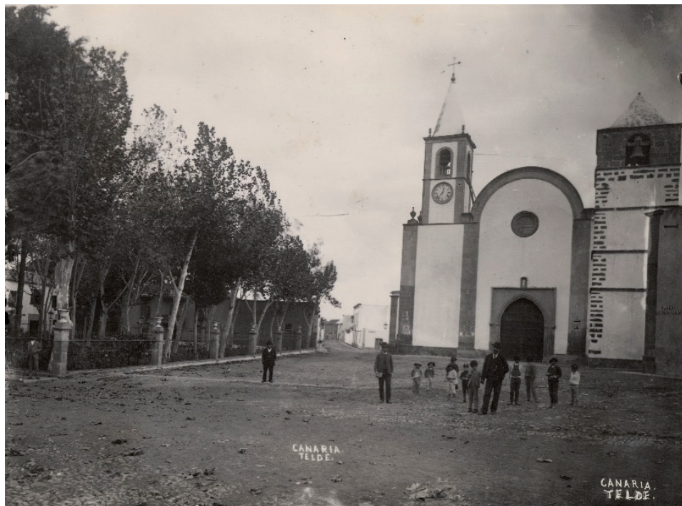
Figura 6. Vista de la plaza y de la iglesia de San Juan de Telde hacia 1890-1893. A la derecha de la imagen puede apreciarse la torre-campanario, hoy desaparecida.

A partir de todas estas evidencias, resulta palmario que la primitiva torre-campanario de San Juan de Telde tenía planta cuadrada, de unos cinco metros de lado, en la zona del fuste que no estaba adosada a la fábrica principal y avanzaba sobre la portada, flanqueándola por su lado derecho. Sin embargo, sus paredes de cantería se integraban en el lienzo del muro lateral de la nave derecha sin que, a partir de los datos disponibles, estemos en condiciones de poder determinar la existencia de discontinuidad alguna entre sus fábricas.