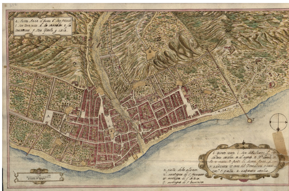
Figura 3. Plano de la ciudad de Las Palmas de Gran Canaria de Leonardo Torriani (s. XVI) donde se observa la catedral de Santa Ana, cuya ubicación coincide con el entorno del antiguo real. Biblioteca Geral da Universidade de Coimbra. Descrittione et historia del regno de l'isole Canarie gia dette le Fortvnate con il parere delle loro fortificationi (Ms 314).