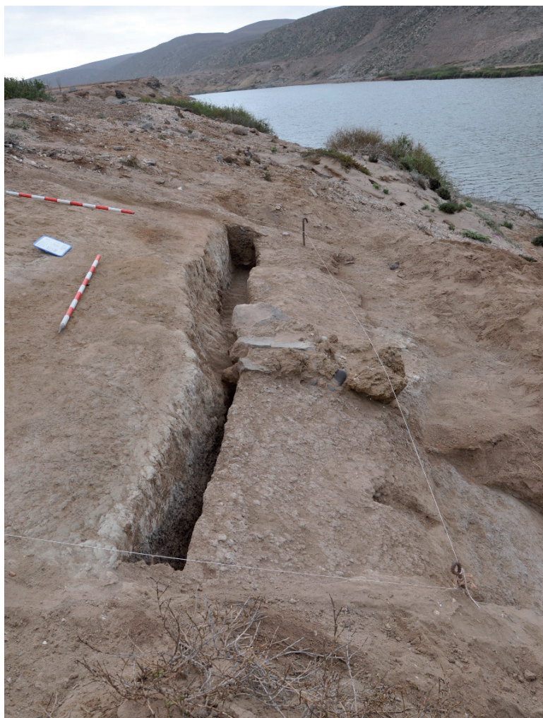
Fig. 12. Tramo de la cerca de tapial reforzado con rafas de mampostería localizado en el sondeo 2 del yacimiento de Fum Asaca (ST-J1).

conocidas (GONZÁLEZ MARRERO et al. , 2011). No cabe duda de que esta asociación de tipos cerámicos resulta de gran interés desde el punto de vista de la investigación permitiendo establecer claramente la contemporaneidad entre las cerámicas de origen europeo y sus equivalentes de la costa atlántica africana. Por su parte, el estudio preliminar de las arqueofaunas pone de relieve el importante papel desempeñado, entre los pobladores de este enclave, por la caza, la pesca y el marisqueo (ONRUBIA et al. , 2016).