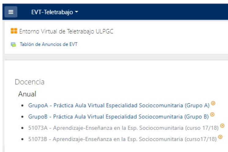
Figura 1. Acceso a los grupos de prácticas de aulas virtuales desde ETV

Fase 2. Diseñada la propuesta curricular que incluya todos los elementos vinculantes generados en la fase anterior, se les facilita el acceso a dos aulas virtuales desde la instalación que se ofrece en el Campus Virtual de la ULPGC denominado trabajo colaborativo o más recientemente EVT-Teletrabajo (Figura 1). En una de ellas desde el rol del profesor podrán generar recursos y actividades Moodle desde la sección asignada y la otra, con rol de estudiante actuarán como tal para que "sus profesores" puedan tener estudiantes que interactúan con ellos y viceversa. Por lo tanto, se crean dos espacios de trabajo colaborativo donde la mitad del grupo de la asignatura tiene rol de profesor y en ese mismo espacio, la mitad restante accede con rol de estudiante. Es a partir de este momento cuando los estudiantes tienen permiso de edición limitada en la sección que les identifica por su nombre y apellidos y, una vez superada la incertidumbre inicial de los diferentes campos y elementos que visualizan para ellos entonces desconocidos, se familiarizan con la navegación del aula virtual y la creación de los diferentes módulos.