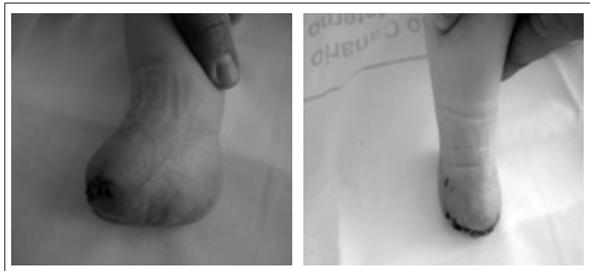
Figura 2 Visión interna y anterior postoperatoria