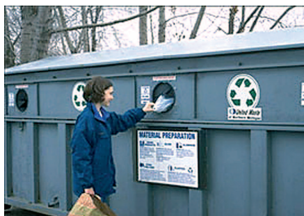
La conducta de reciclado objeto de estudio.

- Se ha demostrado que el comportamiento de reciclado puede ser representado a través de cuatro tipos de modelos que hacen referencia a concepciones diferentes acerca de la pauta de reciclar por parte de la ciudadanía.