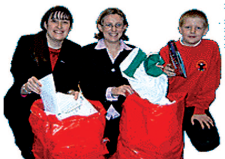
Otro producto de reciclado estudiado es el papel.

mo cuatro tipos de modelos (el modelo inverso, el de baja involucración y el hedonista), los cuales representan diferentes procesos de asimilación e interiorización del comportamiento de reciclado, parece lógico recomendar que un primer paso de la educación medio ambiental radique en el planteamiento de qué modelo de pauta de reciclado se quiere educar, para después poner en práctica los instrumentos de enseñanza adecuados.