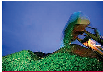
Materia prima recuperada.

El comportamiento de reciclaje ha demostrado jugar un papel destacado como iniciador e impulsor de otras conductas proambientales.