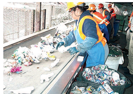
Cinta de separación de residuos sólidos.

Tras realizar el trabajo de campo, se procedió a procesar la información recabada y a analizarla estadísticamente. Sobre la base de los resultados obtenidos y en relación a cada uno de los objetivos plantea-