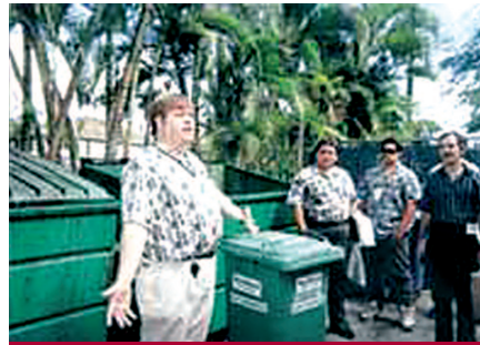
Líder de grupo o Blockleader.

Existen determinadas características de las personas que influyen en la forma de entender y de adoptar la pauta de reciclar.