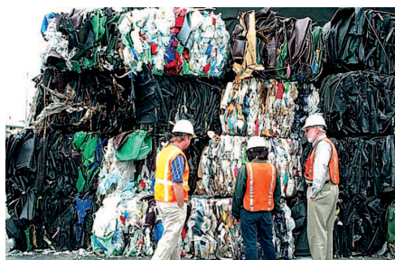
Operarios en una planta de gestión de residuos.

- El reciclado de los residuos del hogar representa una conducta divertida que supone efectos gratificantes para el individuo. Este modelo ha sido llamado hedónico y viene a explicar el efecto de las cada vez más frecuentes campañas para promover el reciclaje de basuras por parte de los ciudadanos.