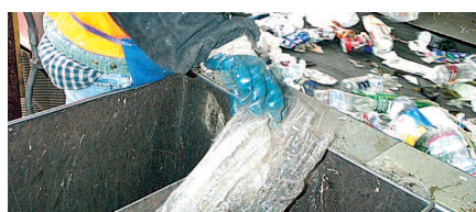
La industria del reciclado representa un yacimiento de empleo.

- La respuesta inmediata a ambos tipos de técnicas de promoción se explica óptimamente a través de modelos de aprendizaje inverso sin que haya diferencias importantes entre ambos procesos de adopción.