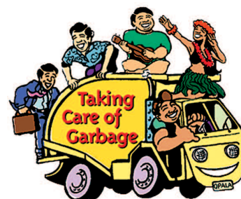
La diferencia entre basura y residuos radica en el principio de sostenibilidad.