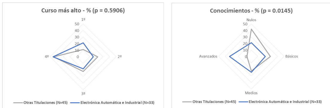
Fig. 2 Resultados porcentuales de preguntas de contexto general: curso más alto (izquierda) y conocimientos de robótica (derecha)

Se observa que más del 50% de los alumnos del Grado de Electrónica y Automática Industrial declaran disponer de conocimientos avanzados o medios de robótica, mientras que cerca del 50% de los alumnos de otras titulaciones expresan que sus conocimientos son nulos.