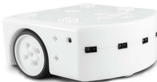
Fig. 1 Robot Thymio

Por otra parte, si se habla de integrar un nuevo método de enseñanza (por proyectos con integración de diferentes asignaturas) y con un material distinto al tradicional (la robótica modular) se debe tener en cuenta que esto supone un sobreesfuerzo tanto para docentes, como para estudiantes puesto que ninguno está acostumbrado a este método de enseñanza, lo que supone un obstáculo a salvar para su implantación.