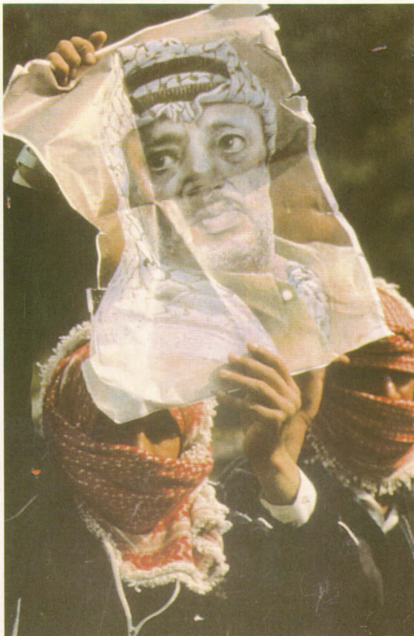
La OLP fue reivindicada no sólo como representante de los palestinos, sino como símbolo de su identidad nacional.

palestinos y su cuestión nacional fue deslegitimada. Uno, para dictar los supuestos estratégicos y tácticos de una apuesta que ellos mismos habían perdido. Dos, por la mayoría de edad alcanzada por el pueblo palestino 4 . Ambos hechos tuvieron una lectura conflictiva pues no coincidieron los objetivos, ni medios, entre el movimiento nacional palestino y los países árabes que lo albergaron, junto a otros desencuentros.