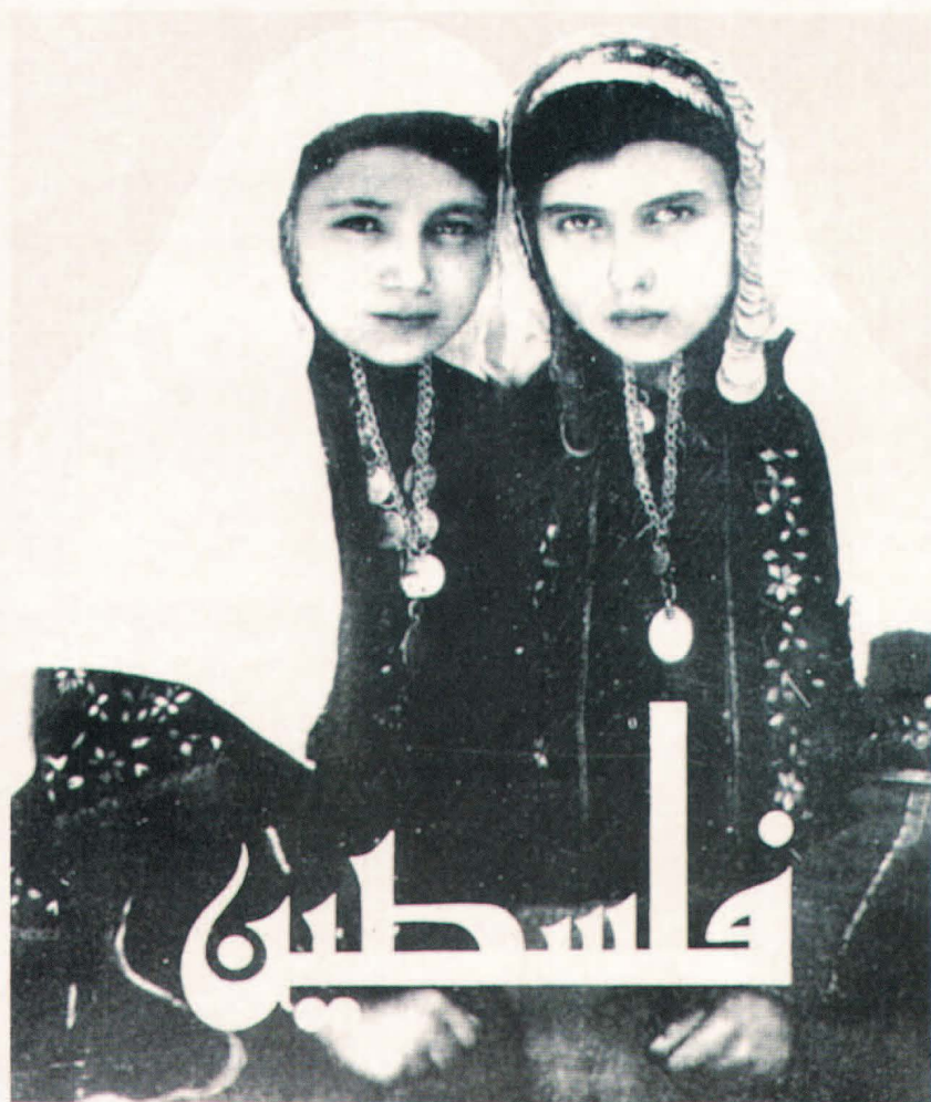
La recuperación del patrimonio sociohistórico fue una referencia clave ante la descomposición de la sociedad palestina.

Privados de la acción pública ante la apremiante tarea de la supervivencia 18 , invirtieron sus estrategias individuales en el trabajo, emigración y educación de sus descendientes. Una nueva generación nació en los campos del exilio, socializada