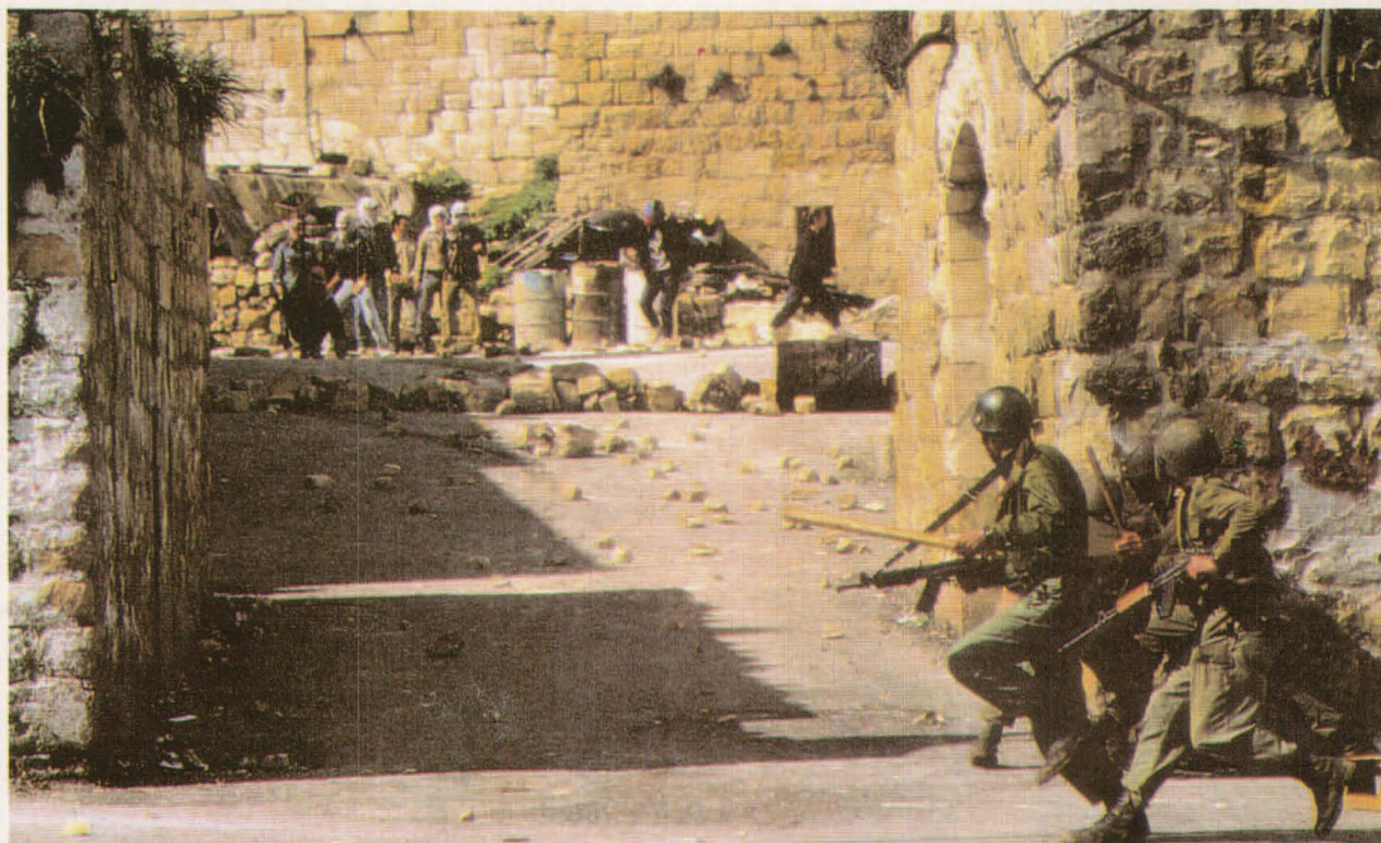
Imagen cotidiana de la Intifada en los territorios palestinos ocupados por Israel.

Este ensayo sobre la cuestión palestina se expone en línea a la teoría de la acción colectiva desde la perspectiva de la elección racional utilitaria o desde la acción expresiva como recreación de una identidad colectiva. En el mismo se analiza la evolución estratégica del movimiento nacional palestino que, entre otros efectos, ha posibilitado la firma de la Declaración de Principios entre la OLP e Israel, en septiembre de 1993, y el actual proceso de paz en el Próximo Oriente