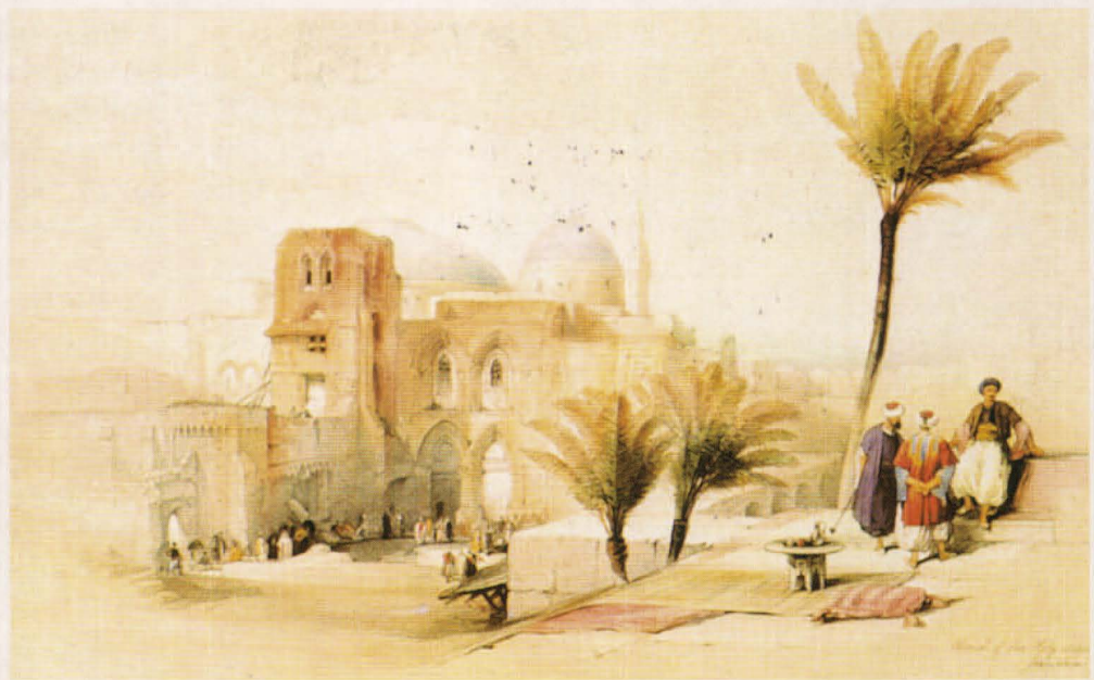
Visión romántica de Palestina. "Jerusalem; Iglesia del Santo Sepulcro". Litografía de David Roberts (1839).

La colonización sionista de Palestina no se realizó a semejanza del modelo clásico. A diferencia de una colonia de factoría, la de asentamiento no tenía como principal objetivo la explotación económica de la población autóctona por otra foránea, sino el reemplazamiento de la primera por la segunda. Por tanto, tampoco existió la privilegiada relación con un capital europeo a la que desviar los excedentes económicos o materias primas. Ni metrópoli a la que la población exógena pudiera retornar o bien quisiera, ya que su asentamiento (de aquí su nombre) no era temporal sino irreversible. Su localización no se limitó a las zonas costeras o urbanas, también se expandieron a las interiores y rurales 11 . Tamaña colonización –similar a la experiencia surafricana– viajó acompañada de una ideología