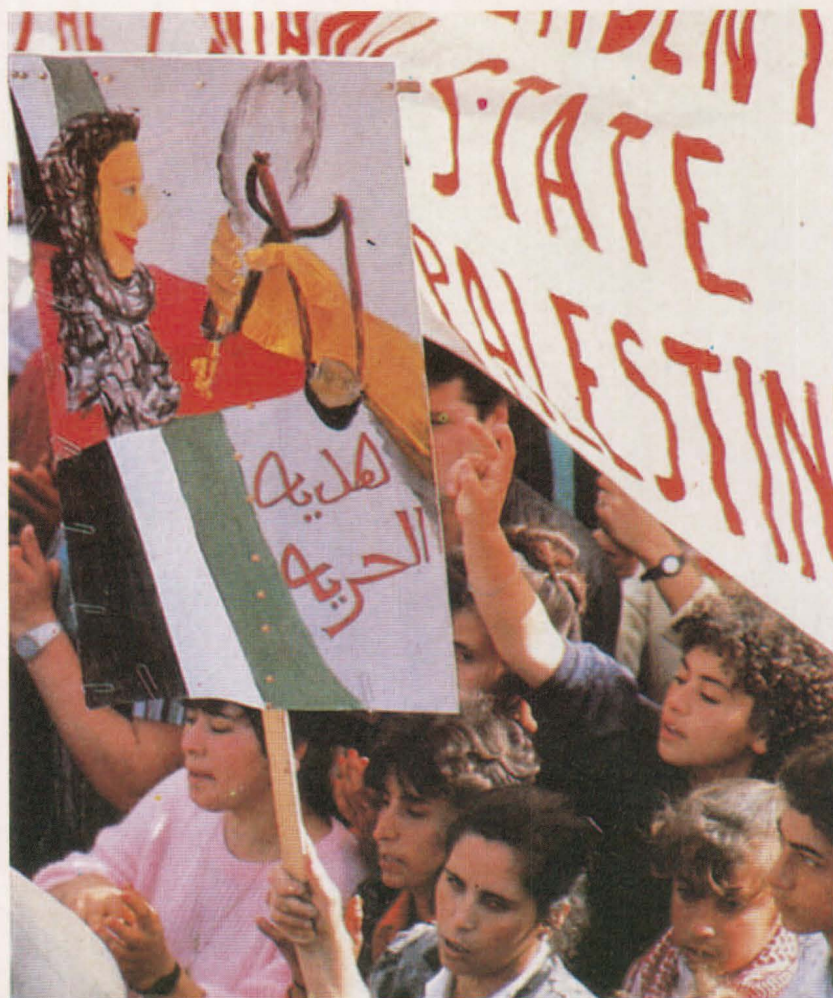
Todos los sectores sociales del pueblo palestino se movilizaron para afirmar su entidad colectiva.

instrumental de las actitudes y creencias dadas de su comunidad en objetivos políticos) arrastra también la movilización por medio de una serie de recursos alternativos no suministrados por el Estado. Asimismo brindan redes asistenciales materiales como las, no menos importantes, pautas de conducta o comportamiento social y político, que cumplen igualmente con su rol incentivador de la cooperación o, en caso inverso, como mecanismo de coacción. Este es el marco teórico en el que insertamos la OLP 22 . Sus ingentes recursos sirvieron de incentivos selectivos a su acción intencional, con especial peso en el mundo de valores y normas de las comunidades de refugia-