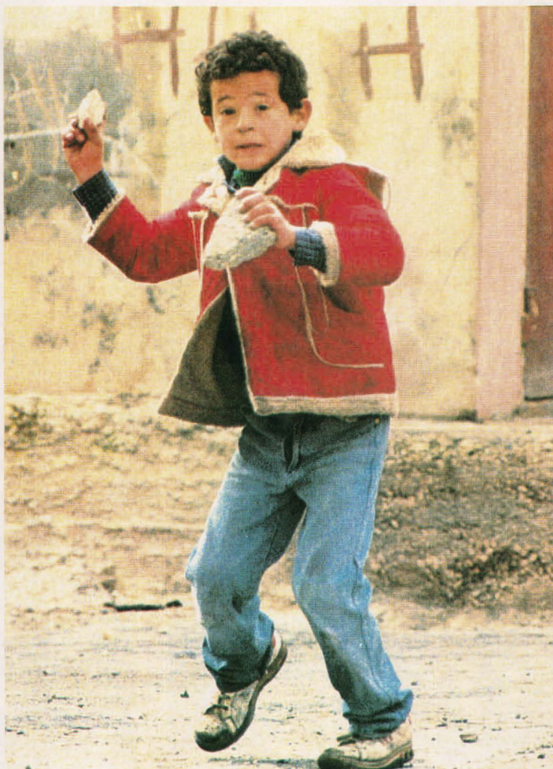
Una imagen típica de la Intifada.

Las elecciones municipales (1972) reflejaron la erosión de la élite tradicional que dejó paso, definitivamente, al nuevo liderazgo nacionalista y pro-OLP en la siguientes elecciones (1976) 35 . El protagonismo de los