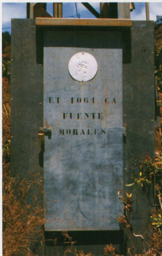
Una caseta construida por EMALSA protege el manantial a unos 140 mts. de profundidad

rales funcionó como único punto de aprovisionamiento para los vecinos de la ciudad durante casi un siglo. No obstante, las condiciones para el suministro no resultaban óptimas: las limitaciones del caudal que producía la fuente, unidas a las dificultades geográficas del terreno por el que debía discurrir la cañería y las necesidades de una población creciente, determinaron que la historia del funcionamiento del acueducto de los Morales quedara plagada de problemas: Un suministro insuficiente y frecuentes intermitencias en el abastecimiento, planteadas como solución precaria ante la imposibilidad de poner en práctica otros recursos, eran dificultades que sufrían continuamente los habitantes de Las Palmas de Gran Canaria, especialmente sentidas durante el estío. A partir de 1875 sobre todo, se estudiaron diferentes soluciones a este problema que pasaban todas por la necesidad de construir una nueva conducción que, partiendo del nacimiento de los Morales, trajera hasta la ciudad la totalidad del caudal que producía aquella fuente. Pero el elevado costo de las obras proyectadas, y las dificultades técnicas que presentaban para las posibilidades de los constructores locales, hicieron que no pudieran practicarse más que simples reparaciones del acueducto en funcionamiento desde 1853.