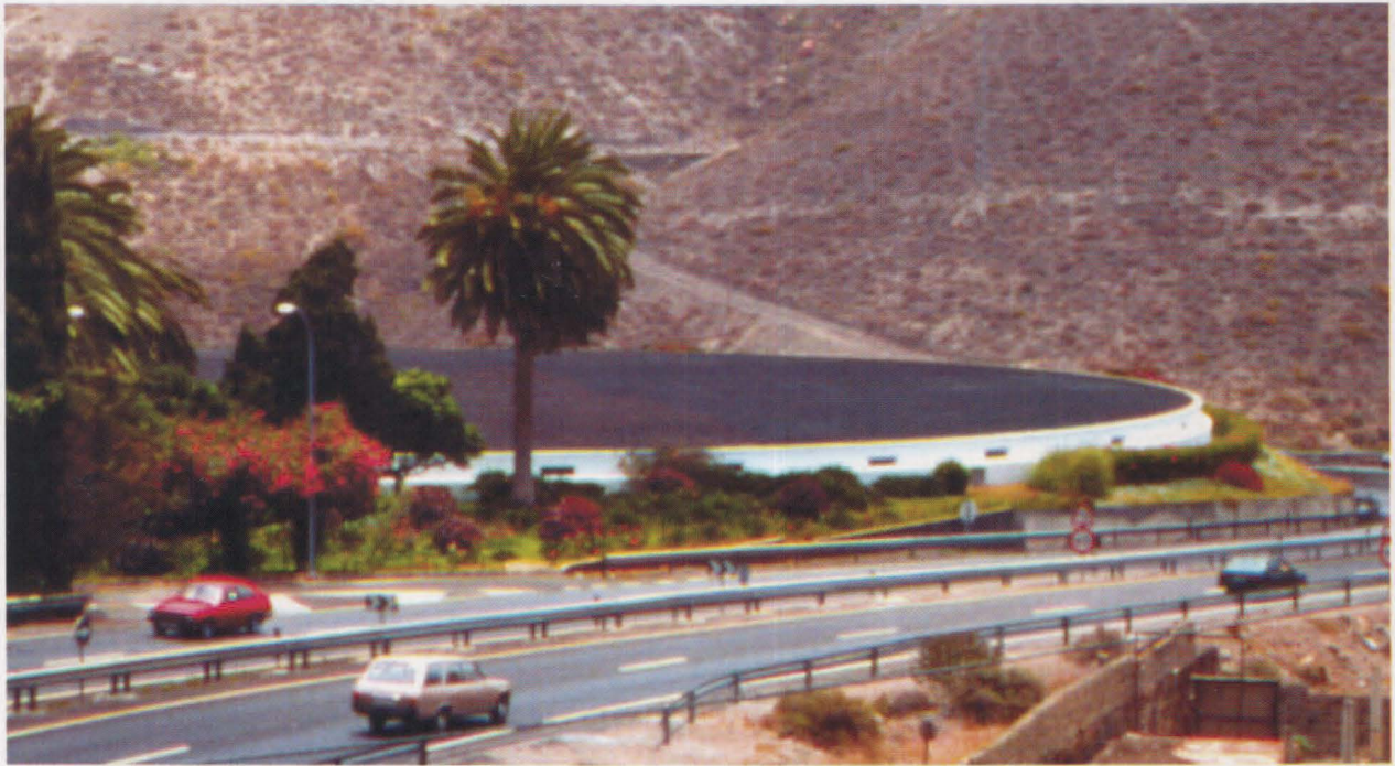
Depósito del Llano de Las Brujas, construido por la City, y por ello conocido popularmente como "tanque de los ingleses"

ciudad consiguió triplicar la dotación de agua y extender la distribución hasta zonas entonces prácticamente desabastecidas. Pero el hecho de haber puesto el servicio en manos extranjeras hizo que los avatares políticos y económicos internacionales repercutieran con fuerza en la localidad, y pronto se entablaron disputas entre el Ayuntamiento y la compañía concesionaria relativas a la interpretación de las cláusulas del contrato entre ambas. A la City no le unía con Las Palmas de Gran Canaria otro lazo que el puramente económico, y el hecho de que la gestión del servicio de abastecimiento de aguas no resultara un negocio tan próspero como inicialmente preveía, dio lugar a rudos enfrentamientos con la municipalidad que se tradujeron en un insuficiente e irregular servicio a la población que llegaría a sufrir incluso, las consecuencias de prácticas fraudulentas de venta de sus aguas para riegos ejercitadas por la City al objeto de incrementar