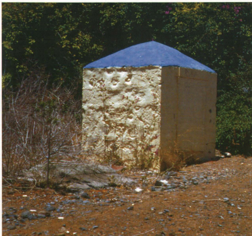
Estado actual del nacimiento "Fuente de los Morales".

El agua, procedente de la Mina de Tejeda, alegraba la ciudad por su abundancia, según describe el Padre Sosa 2 . Sin embargo tras recorrer este líquido aproximadamente 44 kilómetros por el suelo del barranco o por