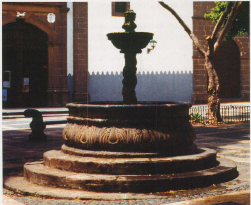
Fuente de Santo Domingo, uno de los pilares inaugurados por Vicente Cano en 1792.

E l sistema de abastecimiento por fuentes públicas era el modo de aprovisionamiento imperante en la mayoría de las ciudades hasta la actual centuria. A estas fuentes públicas tenían acceso, como se ha dicho, de modo igualitario y gratuito todos los habitantes del municipio. Pero ello no quiere decir que no exis-